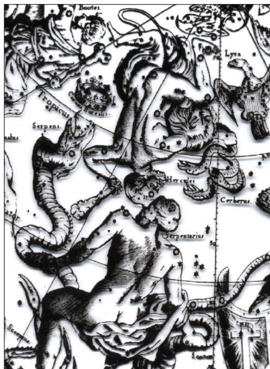
Le détail de la gravure de Albrecht Durer (1515) montre les deux shamans, tête à tête.

L'implication d'Hercule dans le grand cycle polaire met en valeur une orientation cosmique vers des événements qui portent à conséquence bien au-delà de la sphère locale du Zodiaque dans lequel la terre et les planètes circulent. Et cependant, comme nous l'avons déjà souligné, Hercule est intimement associé avec le Zodiaque également. Il est le héros qui réalise des exploits ou labeurs "herculéens" corrélés aux constellations de