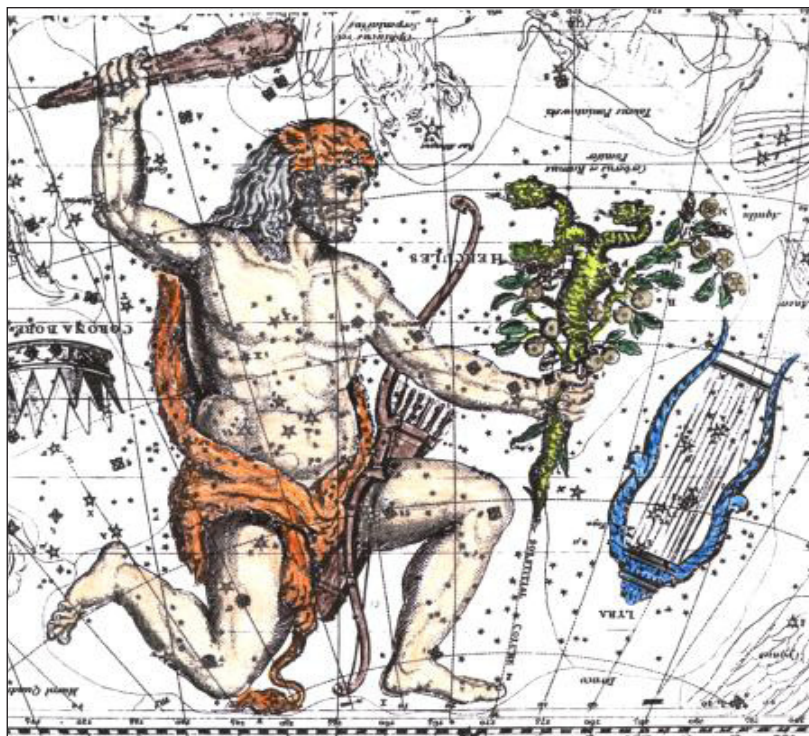
Le détail de l'Atlas de Burritt (1873) montrant Hercule qui tient les Pommes d'Or des Hespérides

Il existe, cependant, d'autres candidats pour la plante magique d'Hercule. Mon premier choix serait Datura stramonium et les espèces cousines Datura innoxia et Datura metel , communément appelées "pommes épineuses". C'est une des plantes psychoactives les plus notoires et les plus puissantes pour notre espèce. En Amérique, elle est aussi connue comme l'Herbe du Diable ou toloache et elle est réputée pour ses capacités de favoriser la divination, le changement de forme et d'autres actes de sorcellerie.